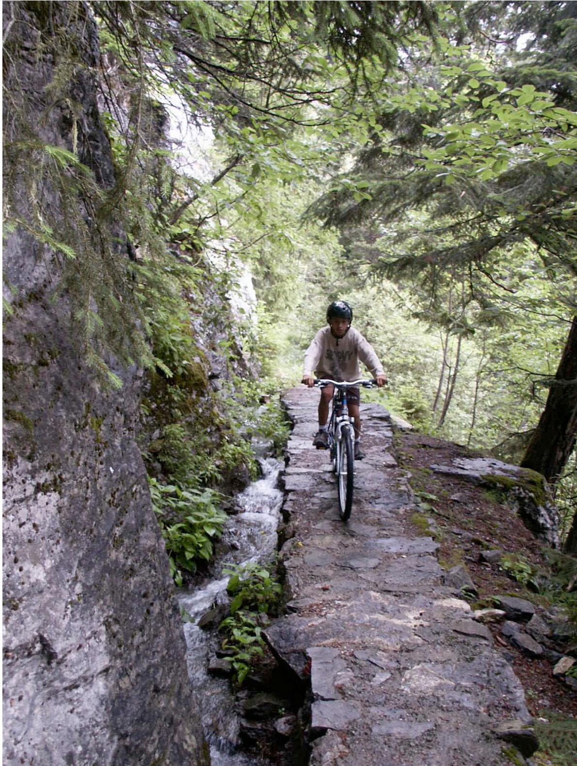
Fig. 2 VTT sur le bisse de la Tsandra (Conthey)