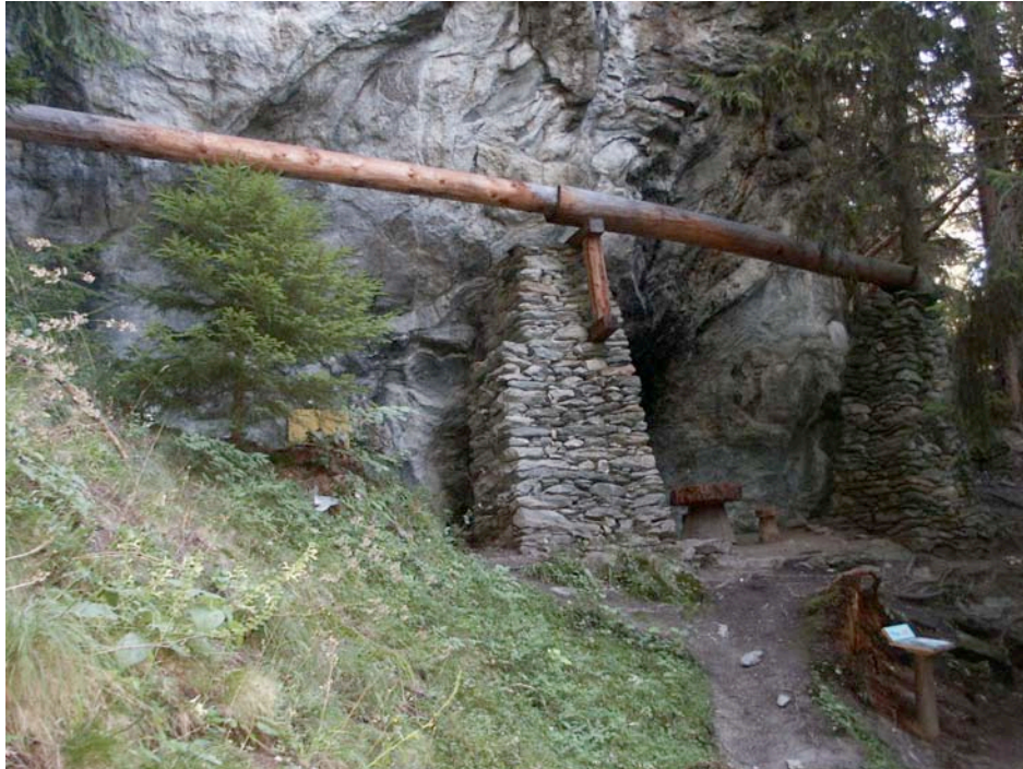
Fig. 4 Restauration de vestiges suspendus au Riederi (Ried-Mörel)