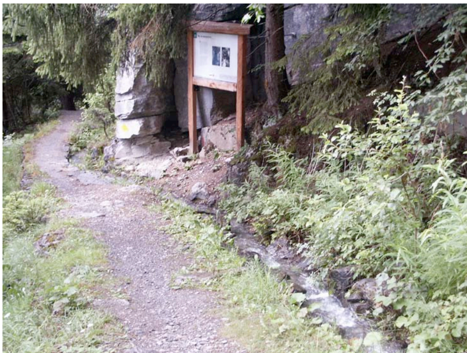
Fig. 5 Panneau didactique au bisse de la Tsandra (Conthey)

Terminons en mentionnant le foisonnement éditorial autour de la thématique des bisses. En plus des brochures mentionnées ci-dessus, il faut saluer la parution en 1999 d'un superbe ouvrage collectif, rédigé sous l'impulsion de l'historien J.-H. Papilloud, organisateur du colloque de 1994, et qui présente de manière détaillée l'ensemble des bisses du Valais classés en 18 régions. Intitulé tout simplement Les bisses du Valais , l'ouvrage, publié en version française et allemande, est richement illustré et offre de surcroît des cartes synthétiques pour