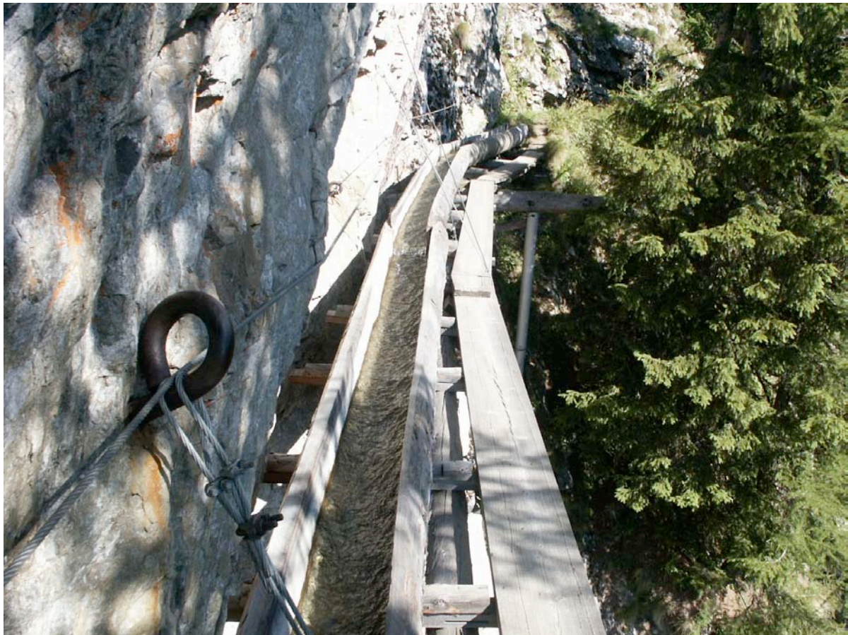
Fig. 1 Passage suspendu au Ladu Suon dans le Jolital

dans une perspective de tourisme culturel. Puis, nous étudierons cette relation entre les bisses et le tourisme, non plus sous l'angle de l'objet valorisé par le tourisme, mais sous celui des moyens de valorisation et de promotion mis en œuvre par le secteur touristique. Nous présenterons d'abord les résultats d'une analyse de contenu réalisée sur différents médias de promotion touristique (dépliants, sites internet). Nous terminerons par la présentation de diverses réalisations concrètes (remises en eau, reconstructions, sentiers didactiques, guides) visant à la promotion touristique des bisses.